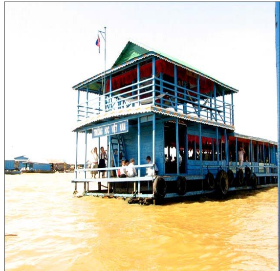
Trường Học Việt Nam nổi trên Biển Hồ (Tonlé Sap), Cambodia

Trong thời gian lưu ngụ tại Việt Nam để thăm bà con và du lịch, tôi đã chứng kiến sinh hoạt của “Trường Học Việt Nam”, là một trường học nổi do người Việt Nam lập ra trên Biển Hồ (Tonlé Sap) thuộc nước láng giềng Cambodia. Đây là một căn nhà nổi trên bè đã do một số thiện nguyện viên người Việt lập ra để dạy dỗ các trẻ em người Việt, con cái của những gia đình vạ chài người Việt nghèo sinh sống trên Biển Hồ. Họ đã cố gắng thiết lập vài lớp dạy trẻ em từ lớp 1 đến lớp 4, để cho các em biết đọc và biết viết, đỡ bị thất học vì cảnh nghèo của cha mẹ.