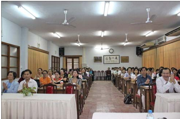
Lớp Huấn Luyện về TĐCĐ LC tại Thư Viện Khoa Học Tổng Hợp TPHCM ngày 8-12 đến 10-12-2009

Như đã nói ở phần trên, tổng số học viên lớp này là 95 người, thuộc các thư viện khu vực phía Nam tham dự khóa huấn luyện này. Vì những vị này đã tham dự những khóa huấn luyện chuyên môn ngành Thông tin Thư viện do Chi Hội TV Đại Học Phía Nam (VILASAL) tổ chức nhiều lần, nên một phần nào kiến thức của họ về TĐCĐ đã có sẵn rồi, do đó giảng viên đã trình bày bài giảng về Hệ Thống Tiêu Đề Chủ Đề của Thư Viện Quốc Hội Hoa Kỳ (Library of Congress Subject Headings) với vận tốc nhanh, với mục đích bao gồm bài giảng và lời giải thích càng nhiều càng tốt vì thời gian hội thảo có 3 ngày so với đề tài này là quá ngắn. Nhiều câu hỏi đã được nêu lên trong lớp này so với lớp ở Hà Nội, về biên mục mô tả, AACR2, biên mục đề mục nói chung, và MARC 21 và cách thiết lập TĐCĐ cho Việt Nam vì hiện nay công đồng TV Việt Nam chưa có một bộ TĐCĐ chuẩn nào cả.