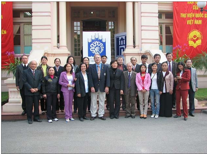
Hình chụp cùng các đồng nghiệp Thư Viện Làng, trước Thư Viện Quốc Gia Việt Nam ngày 24-11-2009