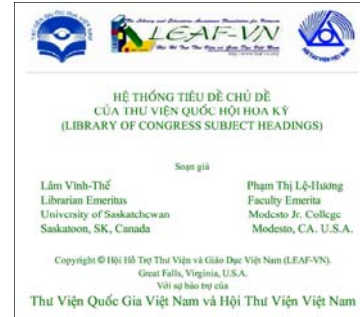
Hình bìa của CD đựng tài liệu huấn luyện về LCSH và Lớp Huấn Luyện LCSH tại Thư Viện Quốc Gia, Hà Nội 25-27/11/2009