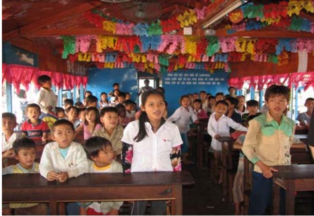
Lớp học của trẻ em người Việt trên Biển Hồ (Tonlé Sap) Cambodia