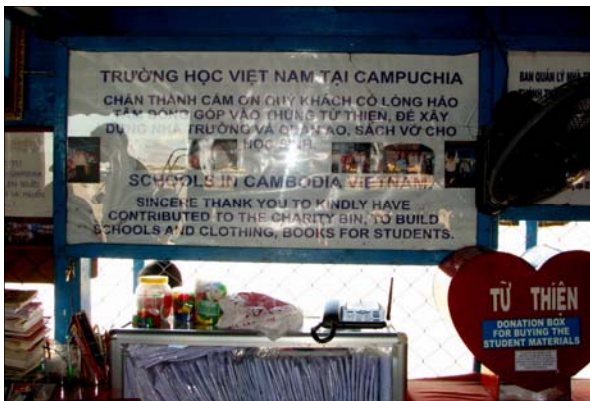
Lời tri ân và kêu gọi trợ giúp các trẻ em Việt về sách vở và ngân khoản để mua sách, tập, bút, quần áo, cho các em.